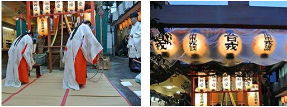
南市恵比寿神社「五日戎」(1/5)

「研究者一覧」の作成にご協力いただきまして、ありがとうございました。「研究紹介シート」につきましては、随時受け付けしておりますので、引き続きご協力くださいますようお願い申し上げます。