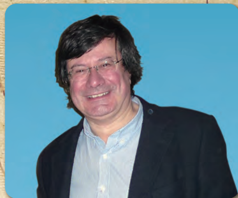
フィオレンツォ・ガッリ氏

講演者：フィオレンツォ・ガッリ氏 (レオナルド・ダ・ヴィンチ国立科学技術博物館 館長)