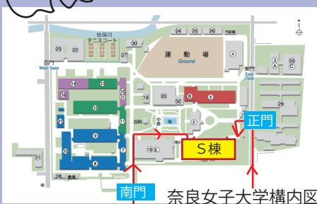
奈良女子大学構内図