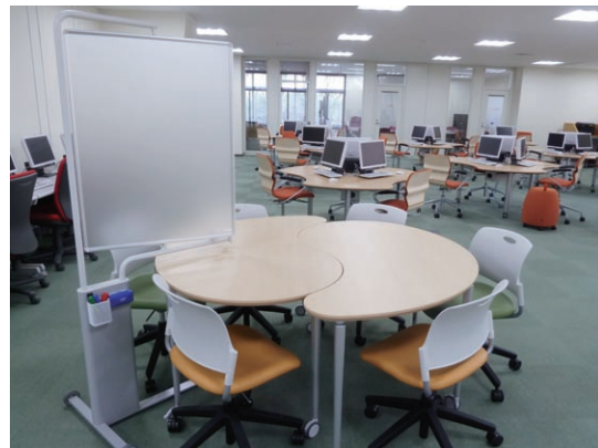
ラーニング・commons Learning Commons