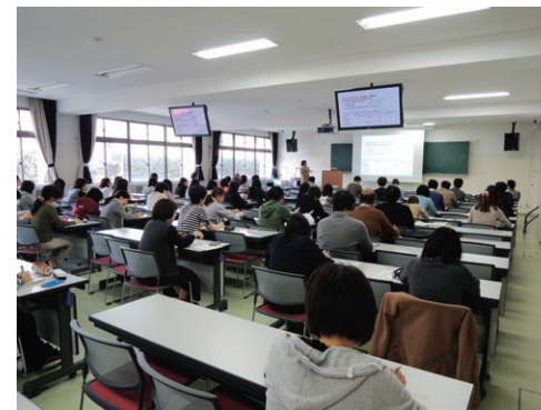
放射線業務従事者に対する教育訓練

The Center consists of three sections, the Management Sections for Chemical Substances, Radiations and Biosafety.