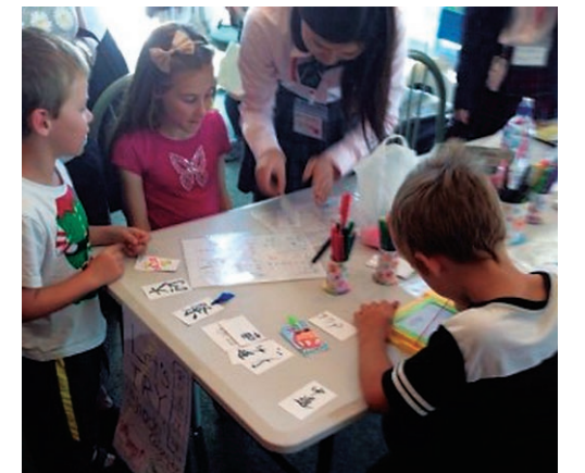
グローバル女性人材プログラムでの日本文化紹介イベント

The center is comprised of the International Exchange Planning Section and the International Education Section. The former carries out the planning and implementation of international exchange and promotes activities based upon academic exchange agreements. The latter offers education and support to international students and guidance for Japanese students going abroad.