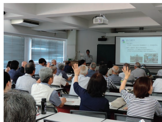
公開講座「奈良の景観の成り立ちを探る」

The Center will survey the promotion of lifelong learning as well as conduct research and development of lifelong learning programs by liaising with local lifelong learning organizations and groups.