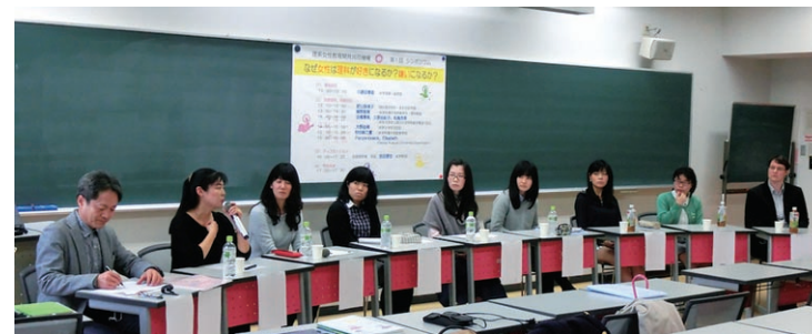
理系女性教育開発共同機構シンポジウムの様子

We carry out education and research in the direction of four projects: Hurdling Assistance for Women in Science Program, Secondary Education Reform Project, Higher Science and Engineering Education Reform Project, and Globalization Project. These are aimed at promoting research for the expansion of career choices in science and engineering for women and developing contextualized teaching materials and methodology in science and mathematics for secondary and higher education, thereby fostering female leaders equipped with scientific thinking.