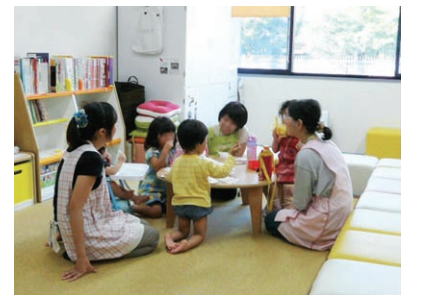
“ならっこルーム”での託児

本学の第1の基本理念「男女共同参画社会をリードする人材の育成ー女性の能力発現をはかり情報発信する大学へー」に基づき、男女ともにあらゆる分野や場面で活躍できる環境をつくるため、平成17年11月に男女共同参画推進室が設置された。平成24年12月に機構に名称変更し、現在は「男女共同参画推進本部」、「ダイバーシティ研究環境支援本部」、「キャリア開発支援本部」の3本部で、男女共同参画の意識啓発、研究教育活動支援、私生活と学業・仕事との両立支援、大学院生やポストドクターのキャリア・パス多様化支援等を行っている。