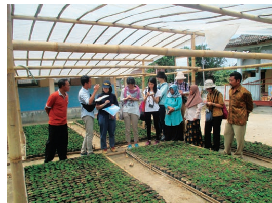
インドネシア研修

Established on November 25, 2005, the Center is dedicated to promote higher education for women in Asia. In present-day Asia, with its great diversity in history, culture, language and political systems, there are emerging sense of unity and common experiences shared by people living in Asia. The Center aims at addressing diverse gender issues in active collaboration with researchers in Asia and contributes to the society by demonstrating research findings, promoting mobility of researchers and nurturing of next generation with a view to establish gender equality within Asia.