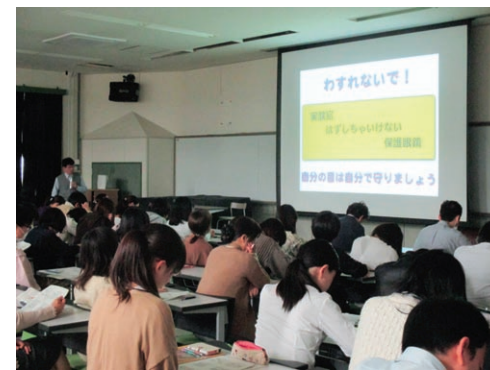
化学物質に係る安全講習会

The Center consists of three sections, the Management Sections for Chemical Substances, Radiations and Biosafety.