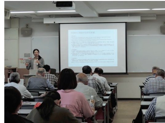
公開講座「観光による地域の食と農の価値の再発見 —ネパール・ベトナム・奈良を事例に—」

The Center will survey the promotion of lifelong learning as well as conduct research and development of lifelong learning programs by liaising with local lifelong learning organizations and groups.