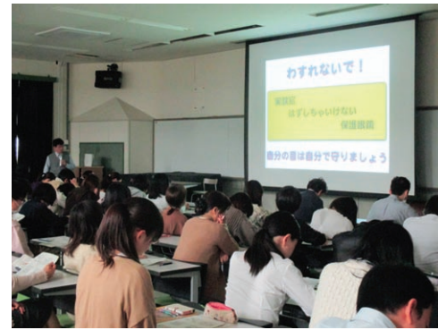
化学物質に係る安全講習会

The Center consists of three sections, the Management Sections for Chemical Substances, Radiations and Biosafety.