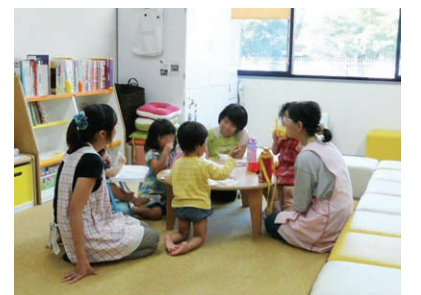
「ならっこルーム」での託児

The first Basic Principle of Nara Women's University is "cultivating human resources that will lead to a gender-equal society and disseminating information for the empowerment of women". The "Gender Equality Promotion Office" was founded in November 2005 to realize this principle by creating an environment where women and men in all fields can actualize their full potential. Its name was changed to the "Organization for the Promotion of Gender Equality" in December 2012, and it is currently comprised of the (1) Office of Gender Equality Awareness, (2) Office of Diversity in Research Environment, and (3) Office of Career Development for Postdoctoral Fellows and Graduate Students. It works to: raise people's awareness of the importance of gender equality; help its researchers with their research and education-related activities; assist its faculty, staff, and students in achieving their optimal balances between work/study and private lives; and support female graduate students and postdoctoral fellows to diversify their career.