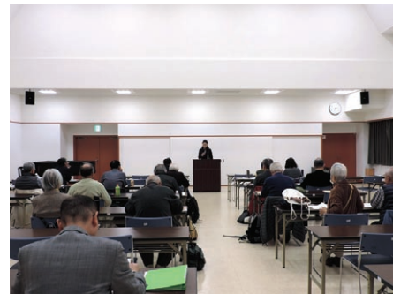
公開講座「新元号「令和」から知る「万葉集」

The Center will survey the promotion of lifelong learning as well as conduct research and development of lifelong learning programs by liaising with local lifelong learning organizations and groups.