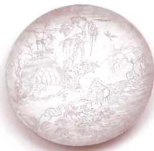
みつだえぼんさんすいえず 密陀絵盆山水絵圖