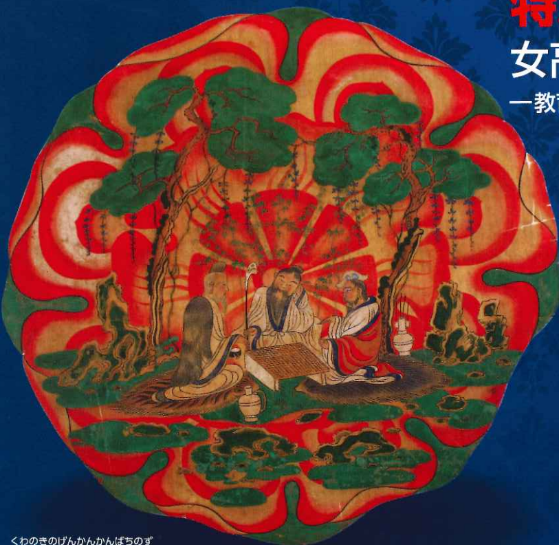
くわのきのげんかんかんばちのず 桑木阮咸捍撥図