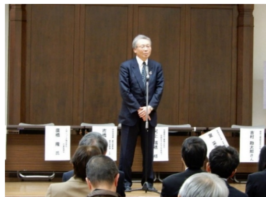
奈良経済同友会 北代表幹事