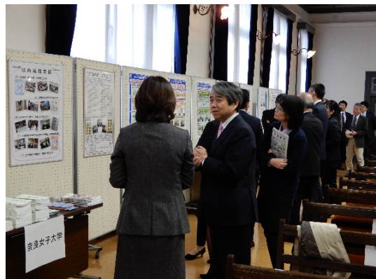
ポスターセッション