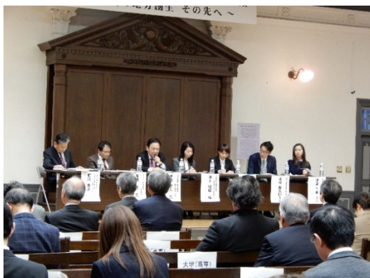
パネルディスカッション